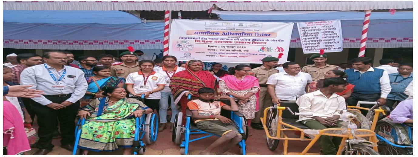
NSS Volunteers & NCC Chhatra with Thashildar Hon. Sonali Metkari