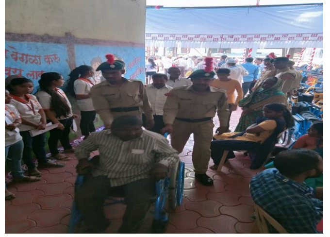
Participation in Assistance to the disabled in Wai Tahashil